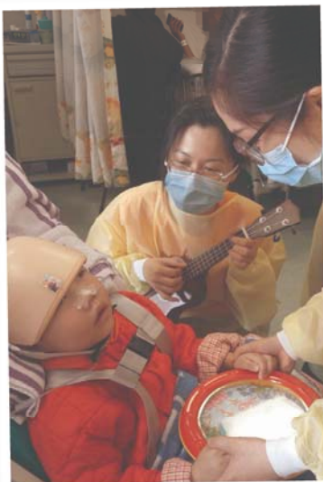
智樂的醫院遊戲小組經常與瑞琳遊戲