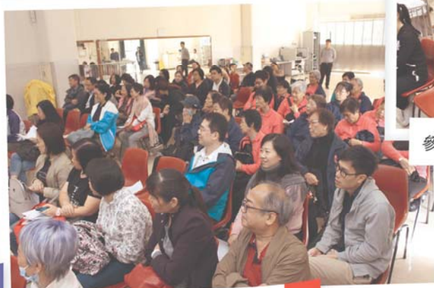
營養講座舉行當天參加者眾