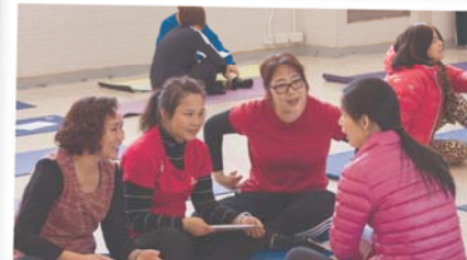
對話打開隔閡，是時候讓我們認識一下