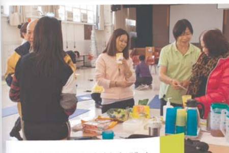
小食飲品讓大家補充體力