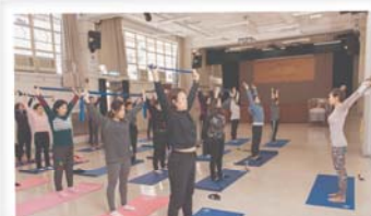
抖擻精神，一起用彈力帶練習