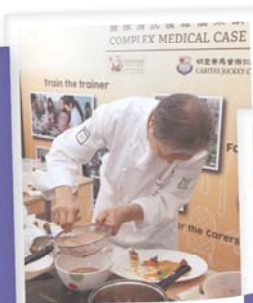
大廚悉心濾出食物精華予同學試食