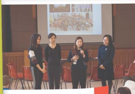
家長分享自己的上課體驗