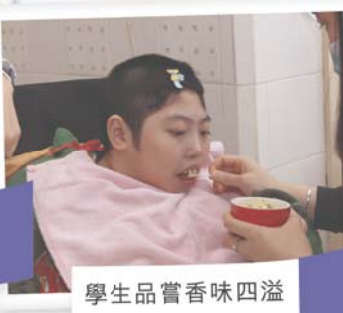
學生品嚐香味四溢的新鮮粟米湯