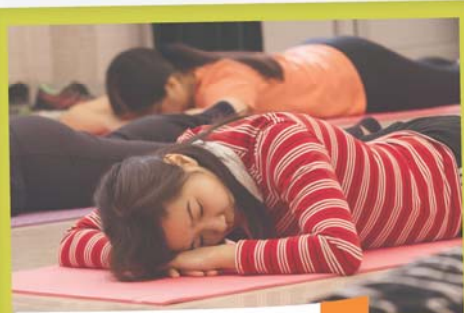
在這裏找到心靈憩息空間