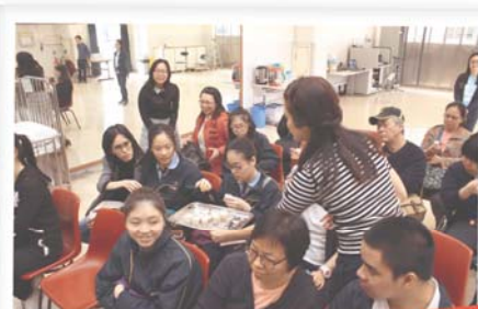
參加的中學生試喝醒神奶昔