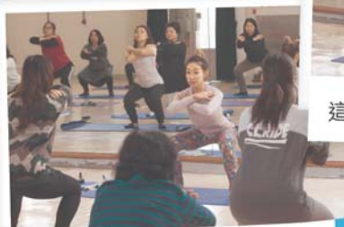
大家的膝蓋不要超過腳趾啊！