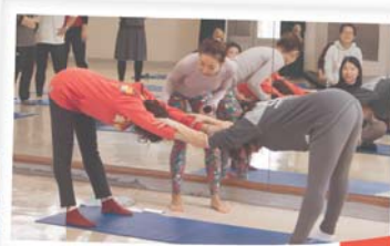
這兩位學員做得非常好！