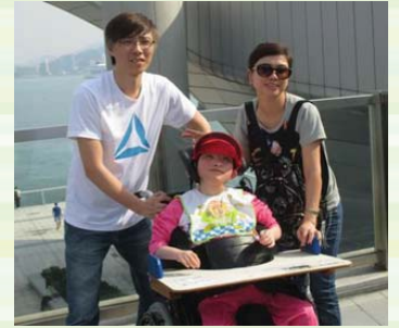
曬曬太陽、吹吹海風