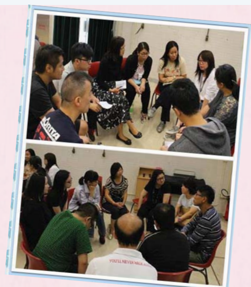
透過分組討論，聯校的教師切磋教學心得，在積極互動中為學與教凝聚力量