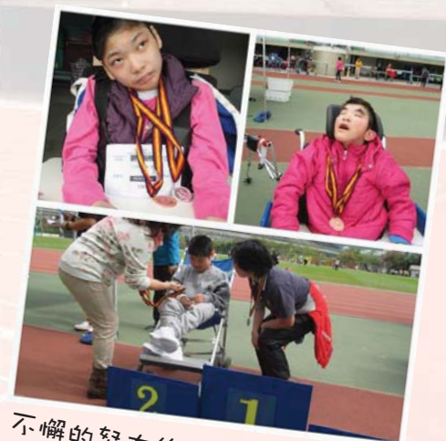
不懈的努力終獲得肯定。學生領獎 的時刻到了，恭喜你們喔！