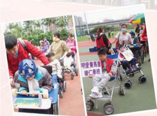
等待參與遊戲活動時，學生不忘 學習守秩序及耐心輪候

2015 年 11 月 26 日，有著秋日和煦的陽光及怡人的微風，更有來自十間特殊學校師生們高昂的士氣。學生參與此公開活動，除了在比賽過程中發揮個人潛能、體驗遊戲樂趣、學習守秩序輪候參與項目，更是難得的機會接觸社區與友校的同儕，交流學習及彼此尊重，一幕幕難忘的片段，讓我們齊來回味吧！