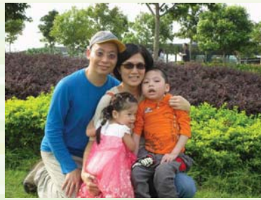
在柔軟舒適的草地上休息拍照也不錯