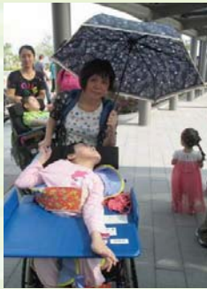
有媽媽在，太陽再猛也不怕