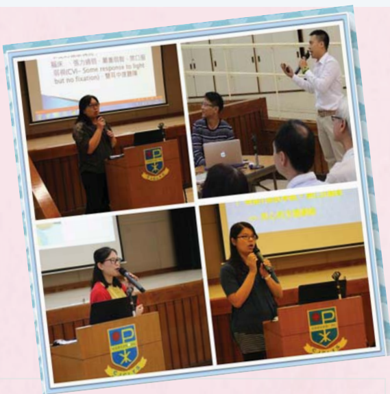
四間特殊學校的老師，細緻地闡釋使用密集互動的歷程

我們深信，在專業發展路上，沒有一蹴而就，靠的是學習、實踐、再學習；只有堅持不懈，我們才能在專業上有所成就，才能為我們的學生，打造未來。共勉！