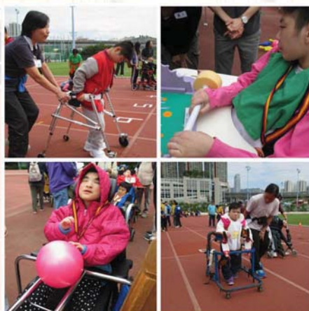
學生善用個人潛能，在不同的 比賽項目中盡力發揮