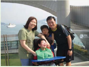
如陽光般燦爛的一致笑容