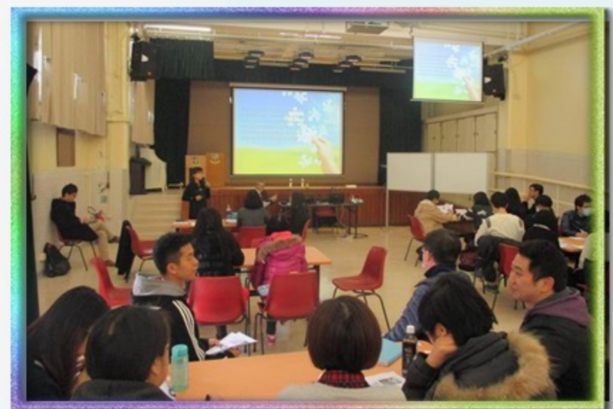
密集式的研習、討論和反思會議， 為教師的專業發展注入了正能量