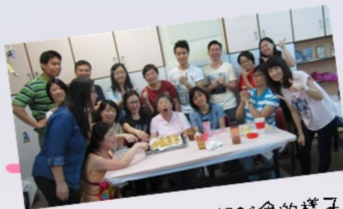
大家急不及待想試食的樣子