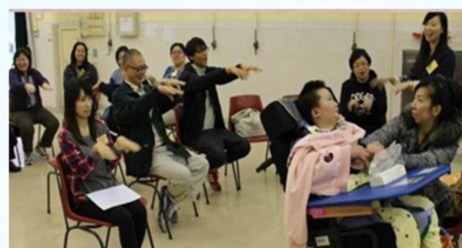
教職員在家長日與家長一同做十巧手，學生也有在家長陪伴下參與