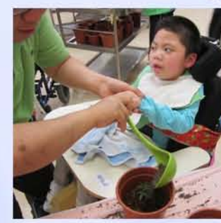
同學投入參與“移盆”，這步驟能令花苗快高長大，亦能近距離接觸泥土及花苗，親親大自然