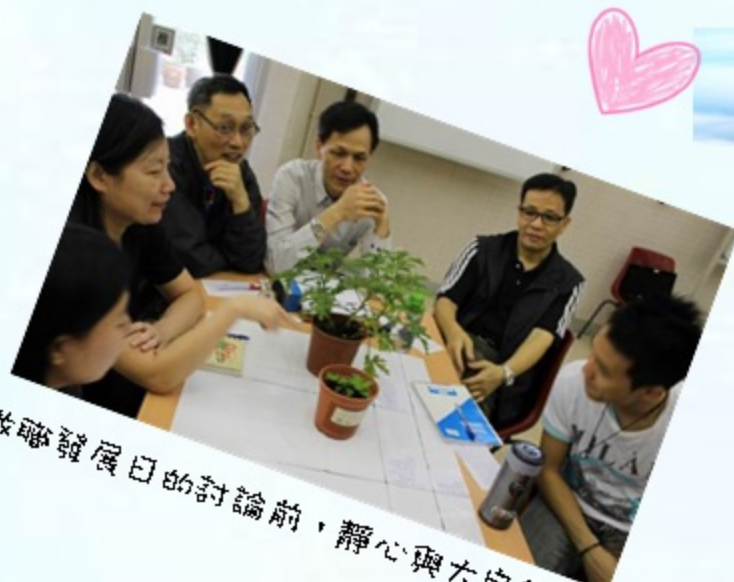
教職發展日的討論前，靜心與大自然相處一會