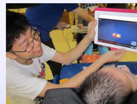
感謝長沙灣天主教英文中學的義工，善用各項感官刺激器材，讓學生各展潛能，體驗不一樣的感官世界