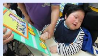
在導師的帶領下，同學能在課堂以外，透過另一形式，學習建立健康的生活模式及做個有禮貌的學生