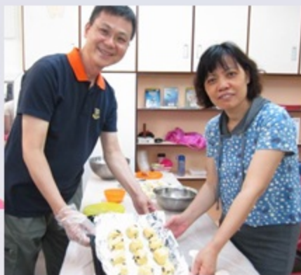
麵團已成，準備入爐了