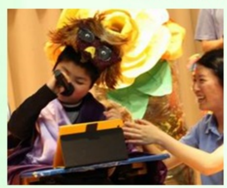
參與演出的同學表現穩定