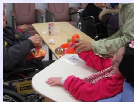
感激明愛醫院天主教牧靈部的義工全程用心帶領，讓同學們投入參與，把滿載愛心的植物送贈長者