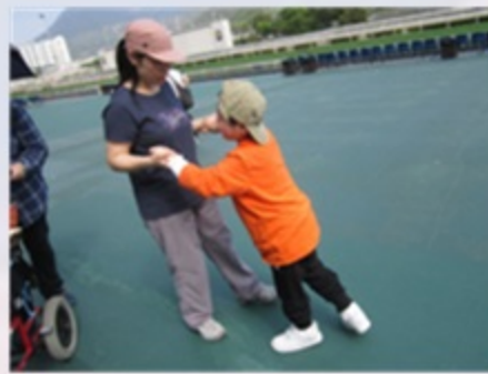
馬場空間寬廣，同學把握機會做運動