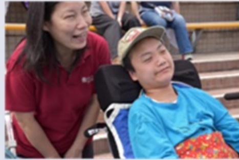
同學細心欣賞台上的表演