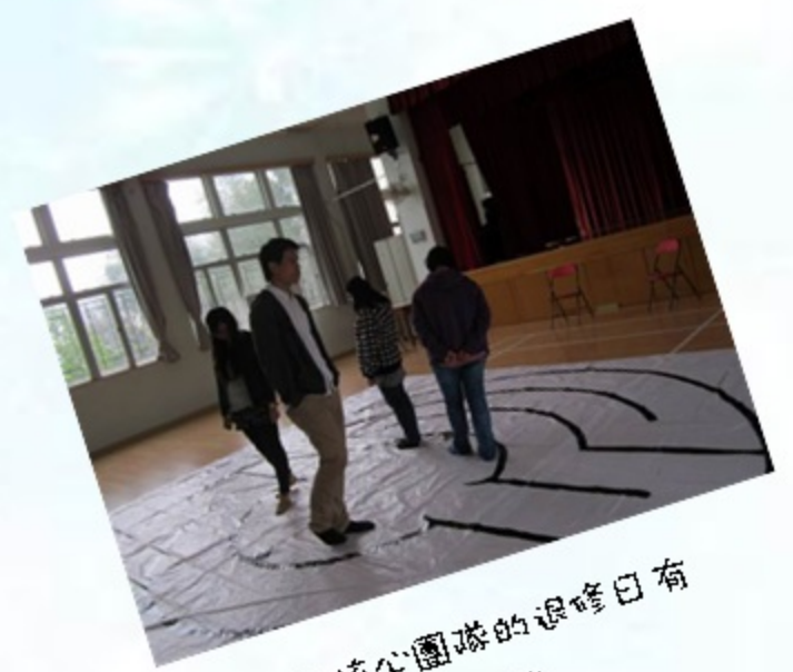
心靈教育核心團隊的退修日有暢行“明陣”的環節