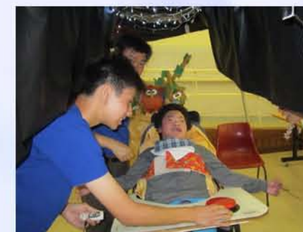
有義工陪伴，同學勇敢地進入“黑洞”探索