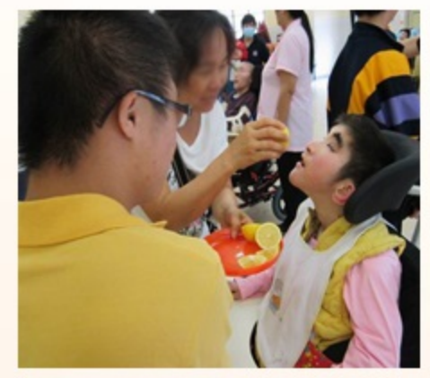
感謝天保民學校的學生及師長，用不同的形式與樂仁學生分享健康食品的知識