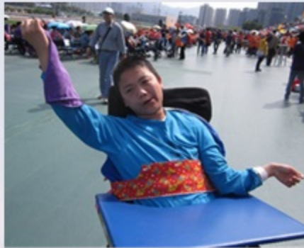
同學配合大會的指示，進行毛巾操