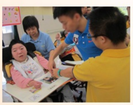
聯校活動讓同學有機會認識新朋友，彼此以握手開展友誼

天保民學校與本校在 5 月 20 日聯手舉辦「健康管理與社會關懷科」活動，藉著兩校學生合作推廣個人健康生活模式。透過攤位活動，讓兩校學生互相認識，一起參與和接受服務，從而身體力行和表達關懷。過程中，學生表現積極、專注、投入和合作。雖然活動只得半小時，學生、教職員和家長義工在充滿笑聲、喜悅和不捨下結束活動。