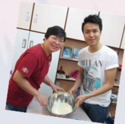
經過一番努力，終於變成幼細的粉末