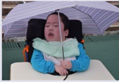
當日陽光普照，同學都做足防曬