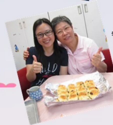
香噴噴的鬆餅出爐了