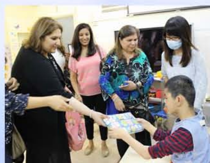
同學們樂意用不同的溝通方式與友善的外籍來賓打招呼，並有禮貌地用雙手接受她們送贈的禮物