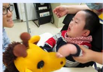
生活教育活動計劃中一個甚受同學們歡迎的環節—與友善的哈樂(布偶)握握手，做個好朋友