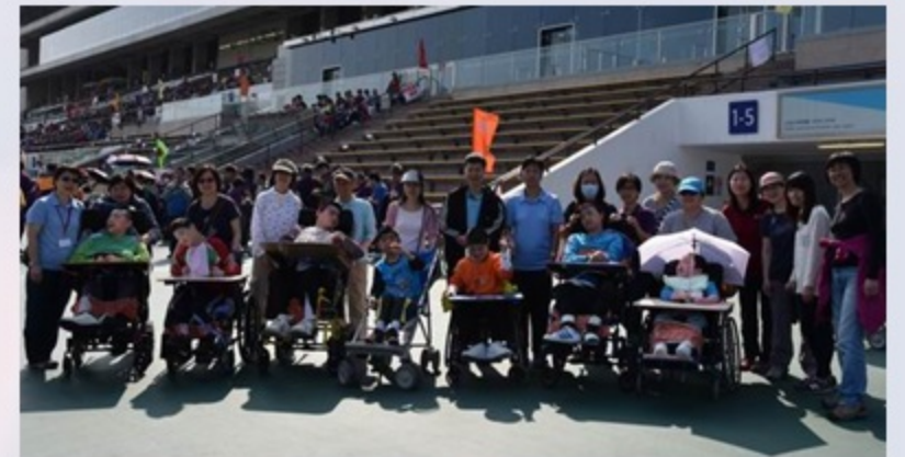
難得參與這盛事，當然要拍大合照啦！