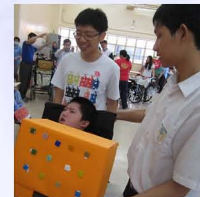
同學與義工向全體師生展示合作完成的“馬賽克”巴士