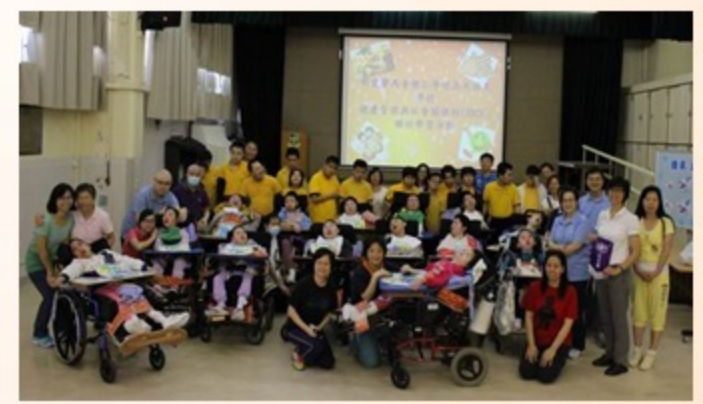
活動在歡欣而融和的氣氛下順利完成，歡迎你們再來囉