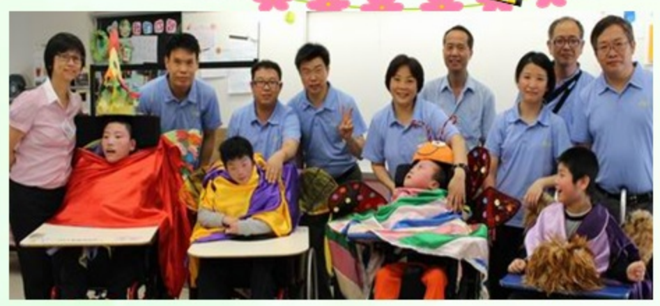
我們的努力得到評判和觀眾的肯定，台前幕後成員來張大合照