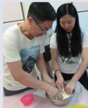
努力地將材料混合在一起