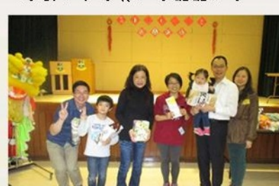
恭喜中獎的幸運兒