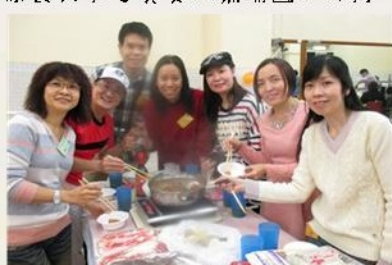
熱騰騰的雞煲令人垂涎三尺