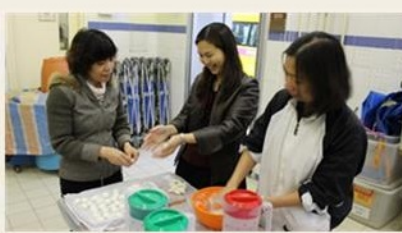
家長與教職員交流煮湯圓的秘方