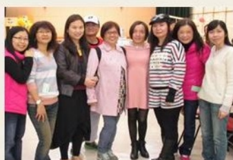
家長和教職員聚首一堂

本年度的新春聚餐以雞煲配火鍋的形式舉行。除了豐富的食物外，更難得是在校及離校生家長、學生、教職員、義工等能夠聚首一堂，歡度一個溫馨熱鬧的晚上。