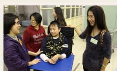
家長和教職員分享籊籊趣事