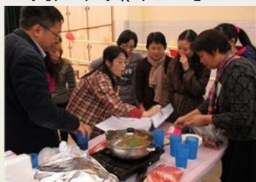
大家為嘞出遊戲都絞盡腦汁