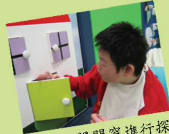
學生打開門窗進行探索