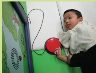
拍一拍擊就可以吹吹風