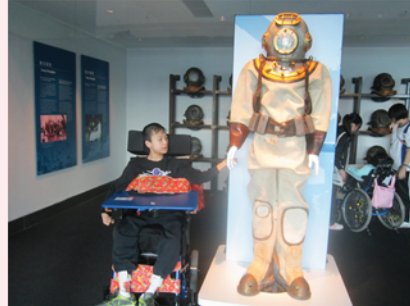
同潜水員握手，感覺如何?