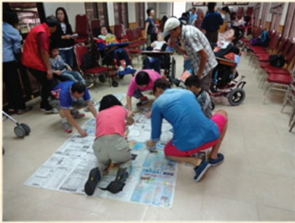
動動腦筋，自製大傘網