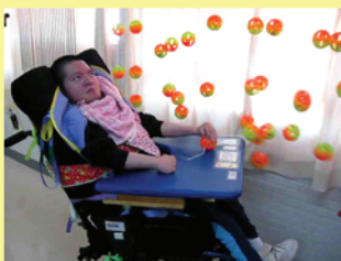
不同“高度”的學生亦能撥响串鈴