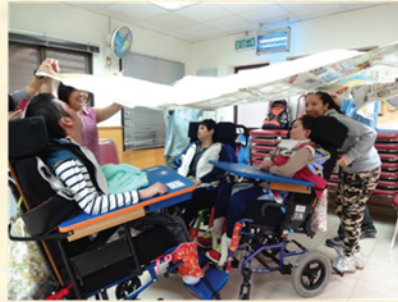
紙製大傘網很堅固呢！