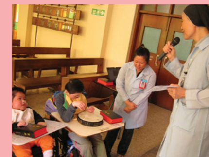
牧靈部鄭修女細心講解聖經故事