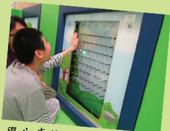
學生專注地觀察滾球的去向

學生在活動室內可運用觸覺、嗅覺進行探索。透過身體/皮膚感受吹風器內的不同風速，察覺身邊環境的改變。學生可運用改裝拍擊來開動吹風板，感受到環境的改變。香味屋內有不同的門或窗，讓學生自行打開門窗進行探索，學生透過自行抓握物件作觀察和探索工作，肌能較弱的學生，可讓他透過觸摸或配合物件的氣味，進行物件的探索增加學生的察覺能力。