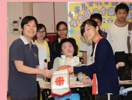
手印畫講求合作無間，協和書院義工、蕭臣山鄉友、樂仁學生，大家都做得很認真呢! 黃老師和學生代表向協和書院義工送上謝意