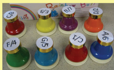
加大按鈕的桌上鈴能讓學生更易按拍