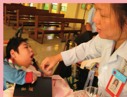
學生觸摸聖經，體驗萬物的美好