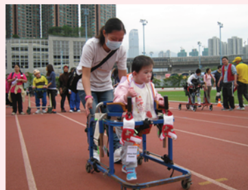
憑著信心，踏步向前!