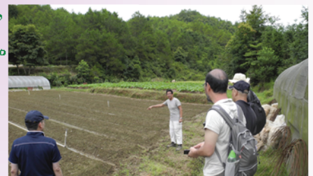
林教授細心解釋各項農產品