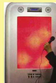
發聲牆能隨著聲音轉換畫面