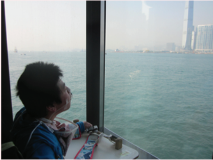
一望無際的大海就在我面前啦!