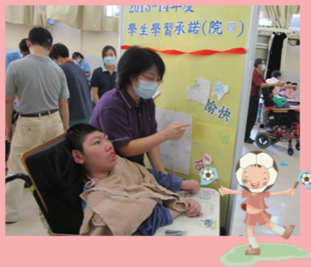
我們對新的學年都有不同大計，願每個期許都能成真，YEAH!