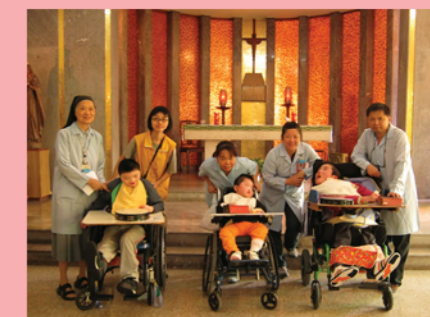
相聚小聖堂，感受寧靜與祝福