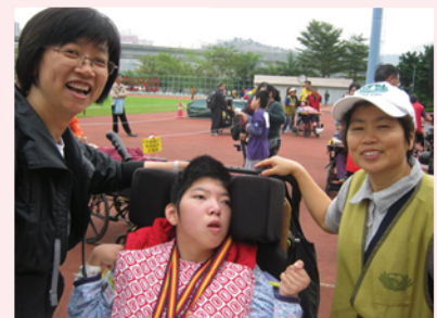
鍾校長與慈濟義工分享學生得獎喜悅