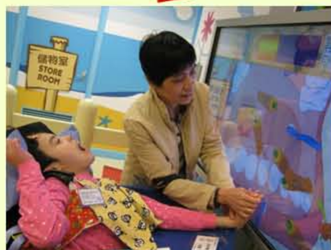
刷刷刷，媽媽和你一起刷！