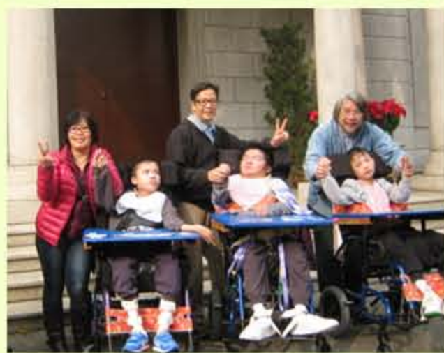
往聖德肋撒堂進行朝聖