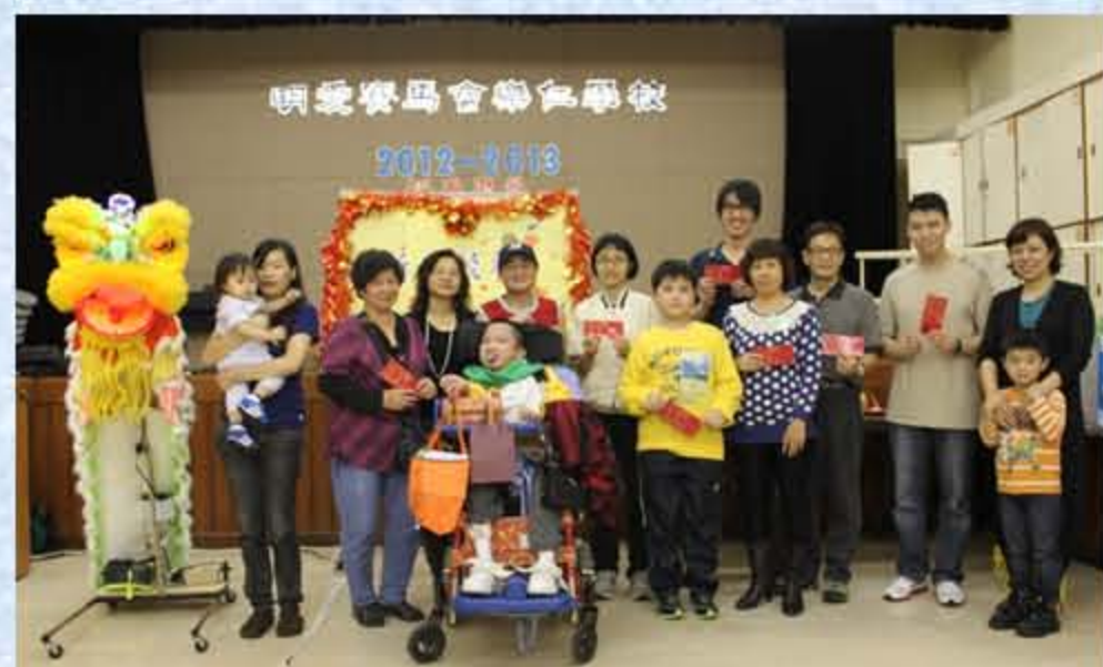
哪些幸運兒抽中大利是呢?