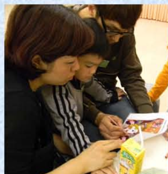
到底兩幅圖有什麼不同?