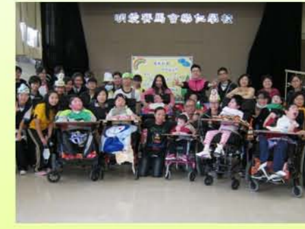
音樂未停，快啲走喇！