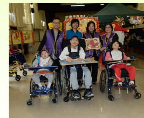
未試過糖蓮藕點算過年呀？