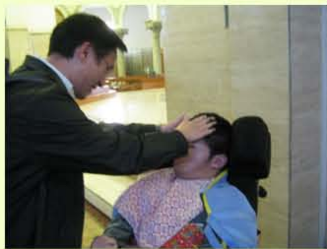
正在接受上主的祝福