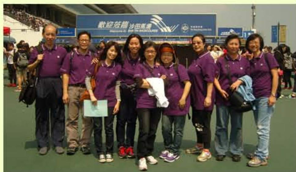
當日天氣晴朗，同事在沙田馬場整裝待發，為明愛籌款。