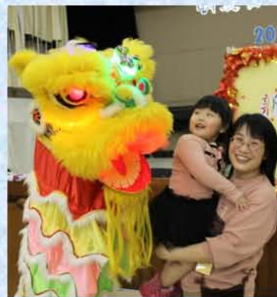
引人注目的電動獅頭