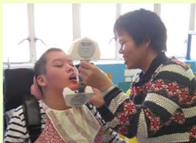
“媽媽，我刷牙好看嗎？”