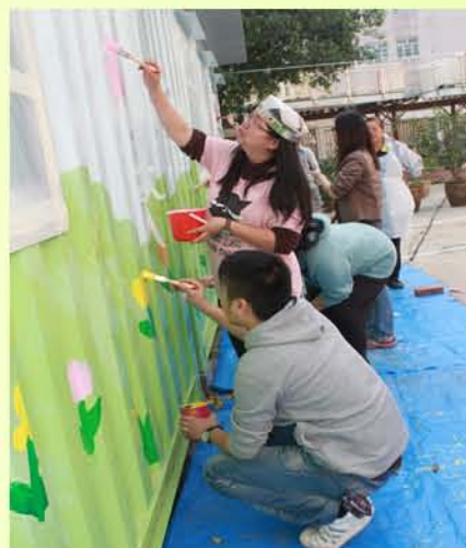
你一筆，我一筆，為貨櫃轉新裝