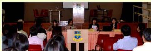
家教會幹事向會員講解會章修訂

籌備法團校董會是需要家長及教職員上下一心，共同參與。故家教會早於 9 月起已開始籌備修訂會章、諮詢家長及教職員的意見，並於 12 月 8 日召開特別會員大會，向會員介紹會章。在會員的投票及見證下，通過家教會會章修訂，為家長校董選舉作好準備。