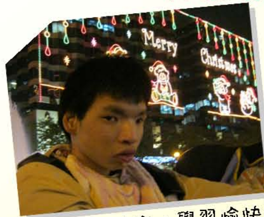
2013新年快樂、學習愉快!!