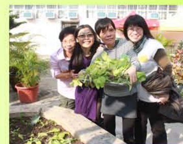
園圃的收成真豐富呢