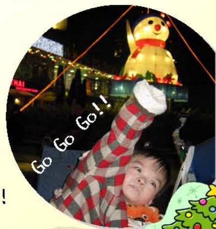
Go Go Go!