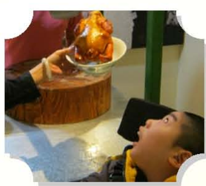
油雞斬大件D呀唔該!