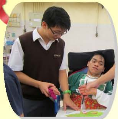
做個好朋友，一同畫張手印畫