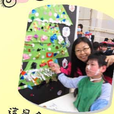
這是全校同學一起砌出的聖誕樹。