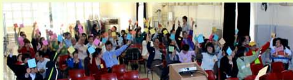
家教會會員投票通過會章修訂