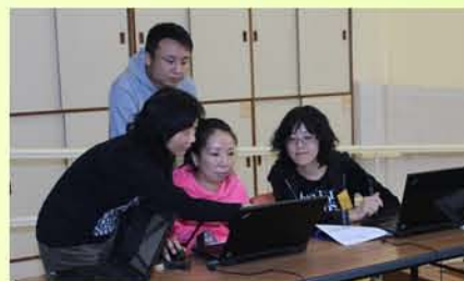
老師指導家長使用學習平台

在12月8日的家長日暨啟發潛能教育發展日，除了讓家長了解學生的學習情況，配合學校推行啟發潛能教育，當日家長及教職員共同參與優化校園的活動，既可聯誼交流，同時豐富學生的學習環境。傍晚，大家聚在一起燒烤閒談，氣氛輕鬆愉快。