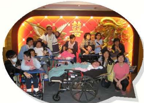
龍鳳大禮堂前來個合照