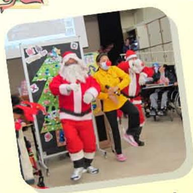
Santa Clau is coming to town...Merry Christmas!!