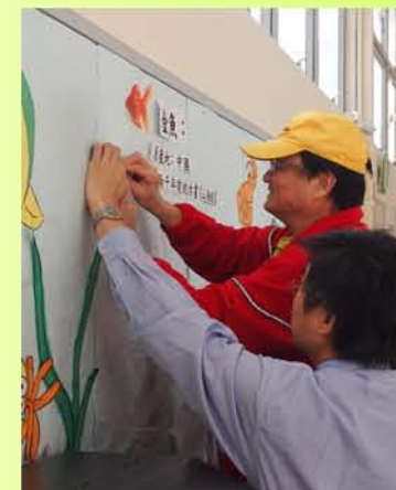
齊齊佈置地下大堂