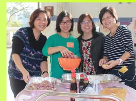
製作美味燒烤食物