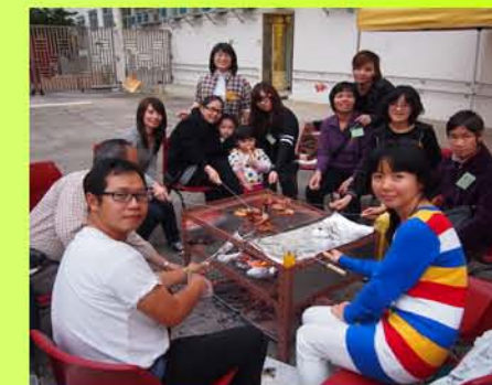
家長教職員藉燒烤聯誼