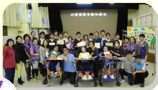
開開心心影張大合照