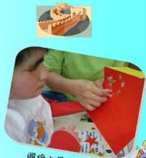
國旗上是有五粒星的!