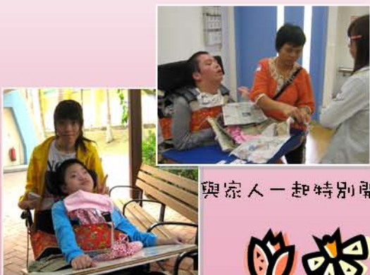
與家人一起特別開心呢！