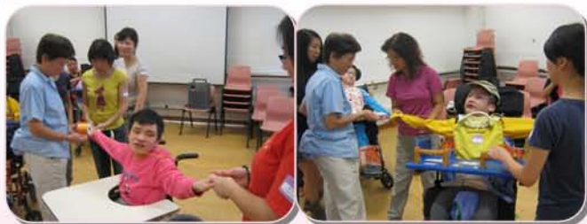
「世界之最」，猜猜誰的手最長？