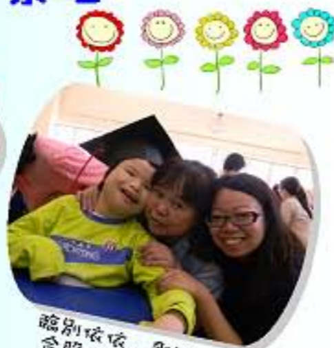
臨別依依，影張合照做個紀念!