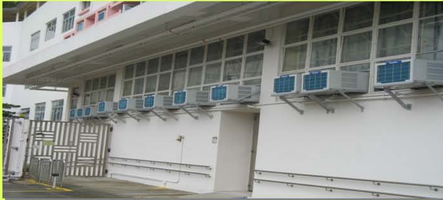
完工後的禮堂外觀

本校獲「環境保護運動委員會」及「環境及自然保育基金」贊助「更換禮堂冷氣工程」，更換 16 部兩匹窗口式 1 級能源冷氣機，全部費用共港幣 $76,960.00。