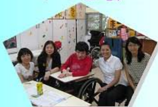
老師，我今年的表現如何?