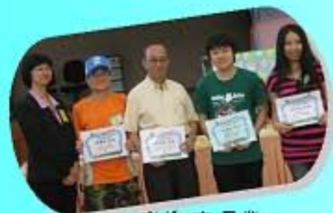
感謝家長對學校的支持!