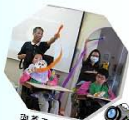
與員工一起玩，真開心!!