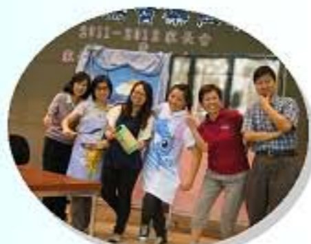
我們同事的表演精彩嗎?