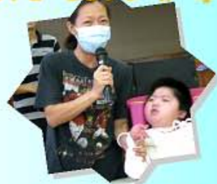
在老師陪同下，新學生向全校同學打個招呼。