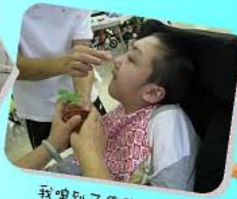
我嗅到了香草的味道!