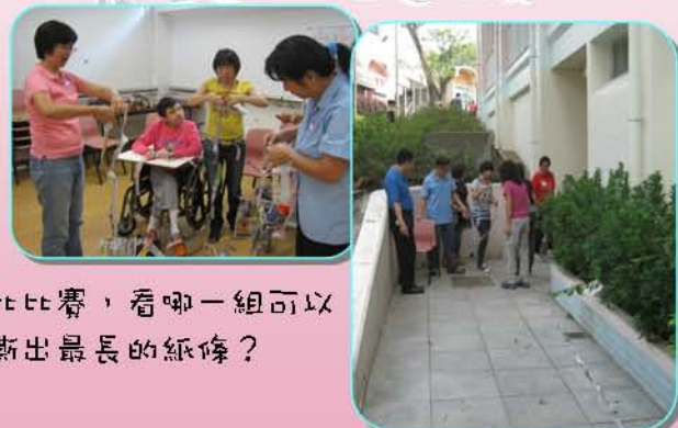
比比賽，看哪一組可以 撕出最長的紙條？