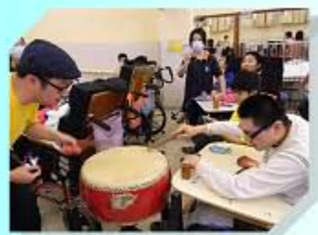
一「鼓」作氣，擊出聲勢無比!