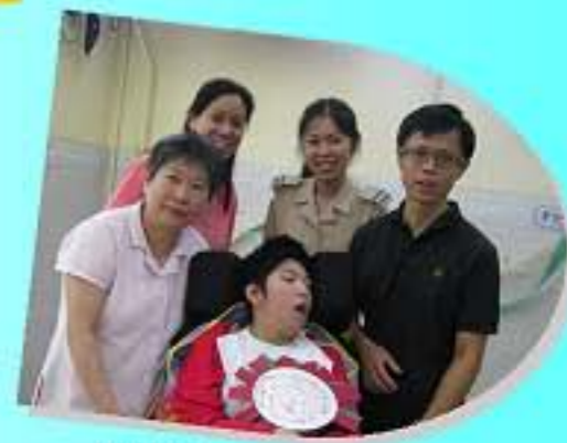
把整年的學習目標畫在花花之上，我要努力學習!