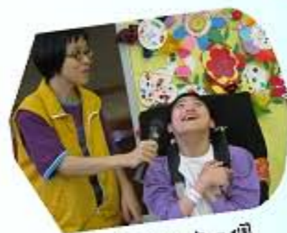
同學為我們作一個開學祈禱。