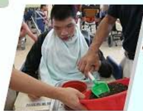
一分耕耘，一分收穫。