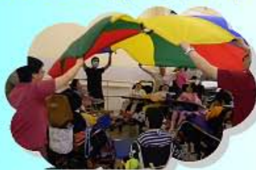
這學期告結了!在彩虹傘下說聲珍重，適些見!