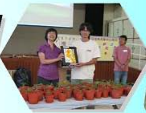
校長致送紀念品予員工。