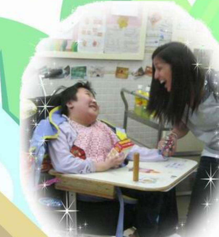
專注的聆聽探訪者唱歌