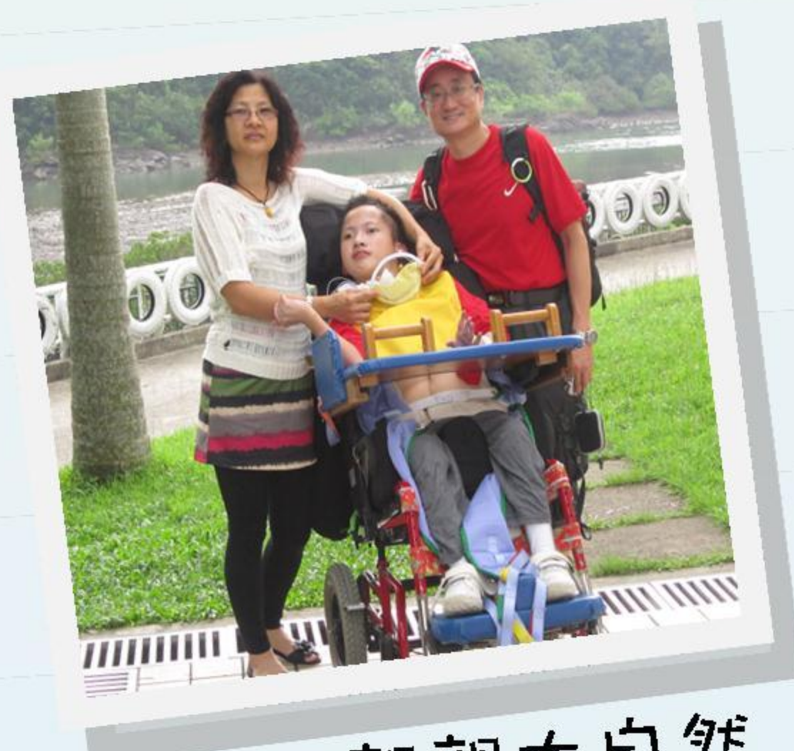
一家人親親大自然