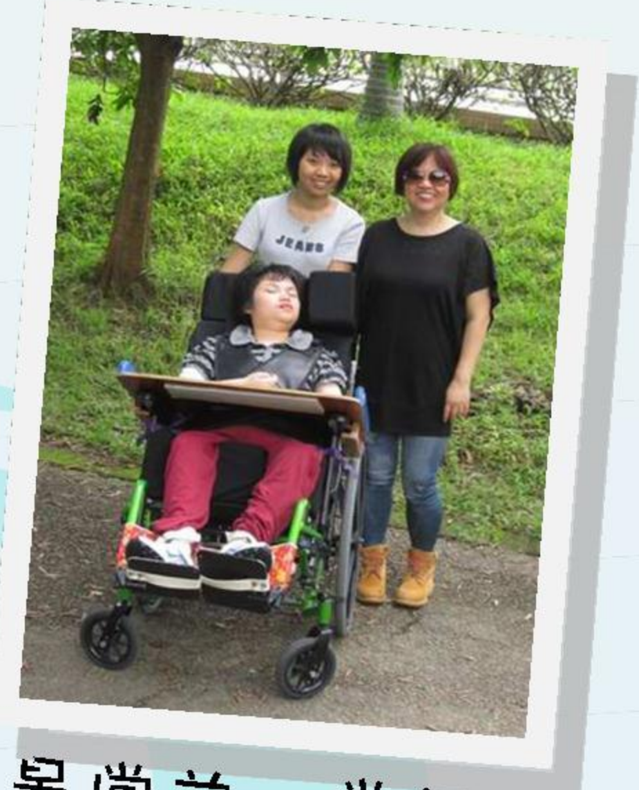
美景當前，當然要同家人影相留念啦