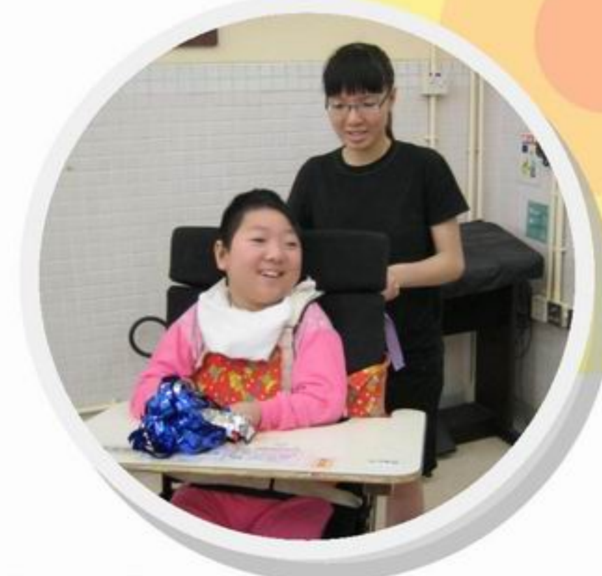
我們「坐船」出海，搖搖搖！