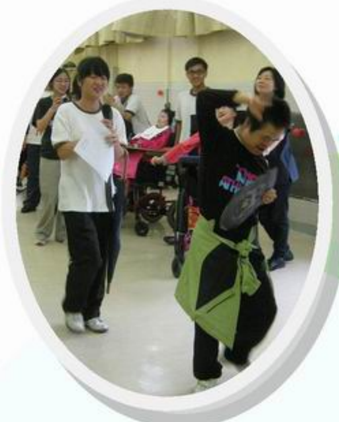
義工與同學合演話劇