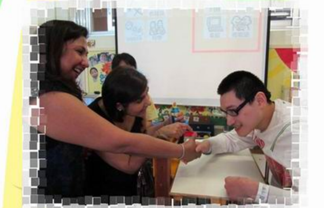
與探訪者握手打招呼