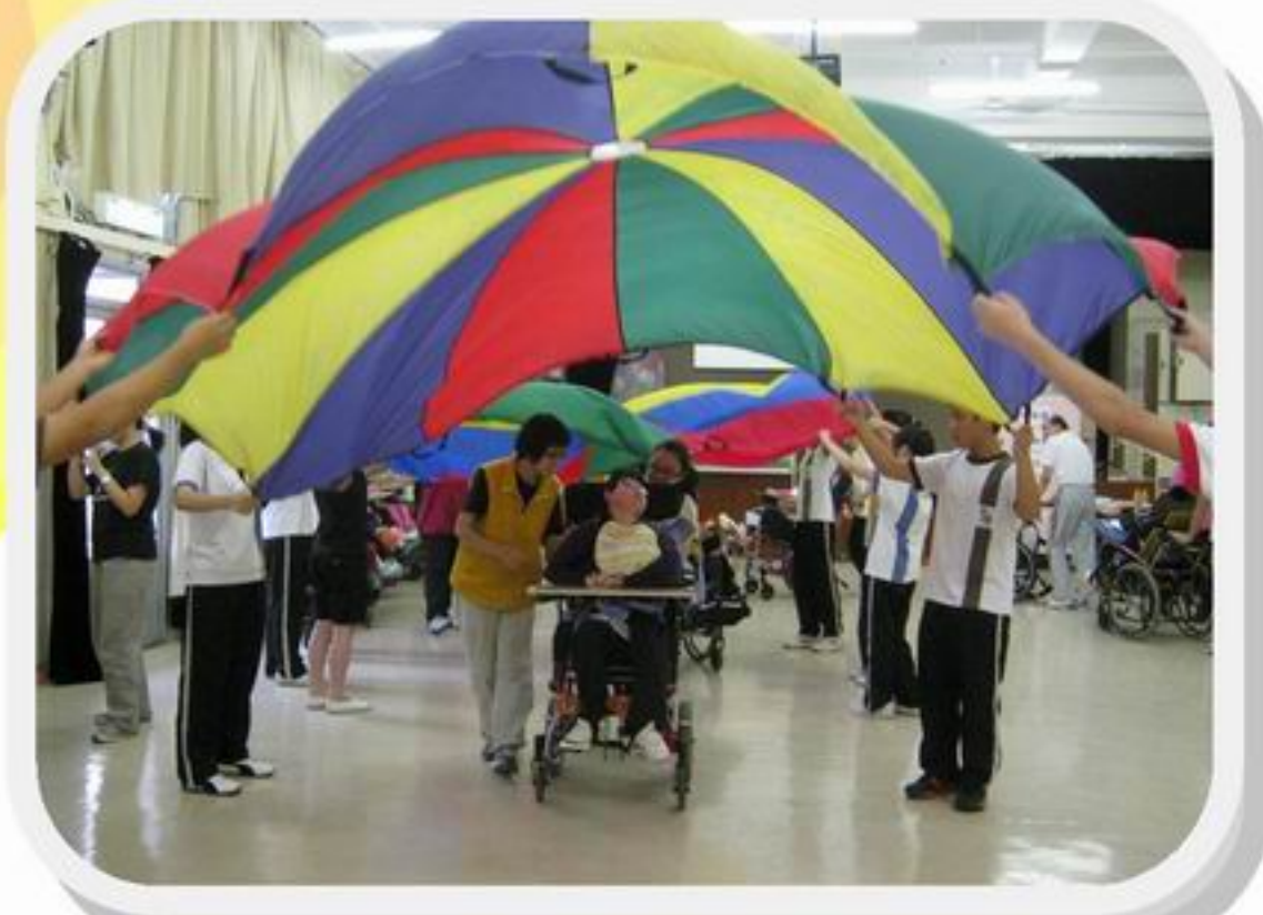
穿過色彩斑斕的人生大道