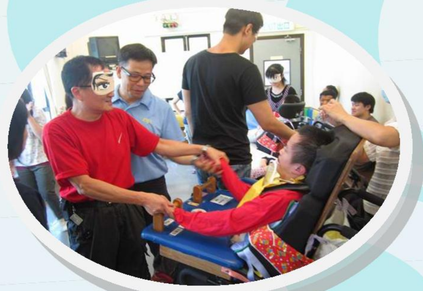
究竟邊隻手仔先係阿仔呢？