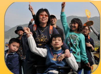
齊齊參與「同心同行活力操」表演！