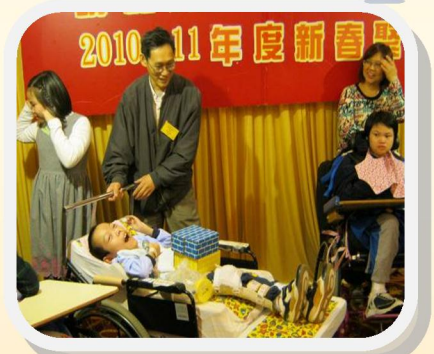
同學們一齊參與魔術表演！又開心、又精彩！

學生、家長、學校教職員及醫院同工一同參與手指畫創作，代表大家同心協力，讓同學們能在一個充滿愛及關懷的環境下茁壯成長，好像這棵樹一樣能茂盛生長、活出精彩人生。