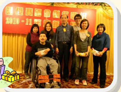
睇吓邊位幸運兒抽到獎？