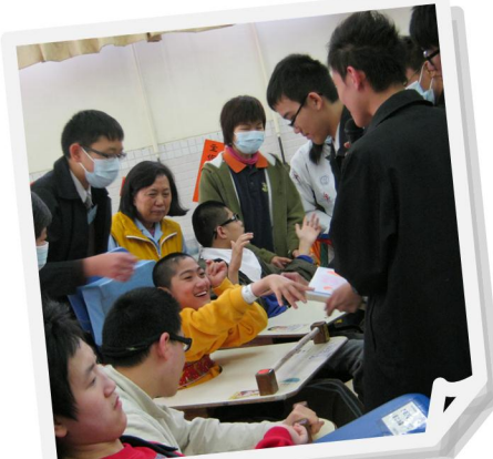
我中獎了，很開心呀！