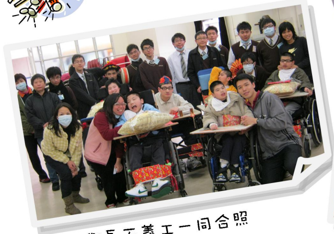
與長天義工一同合照