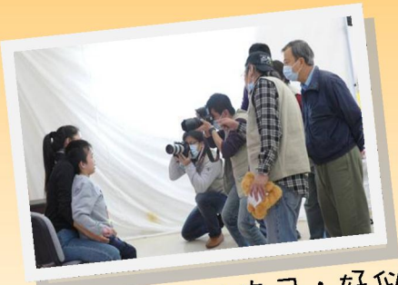
好多鏡頭對住自己，好似明星一樣呀！