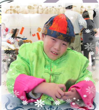
恭祝大家身體健康！