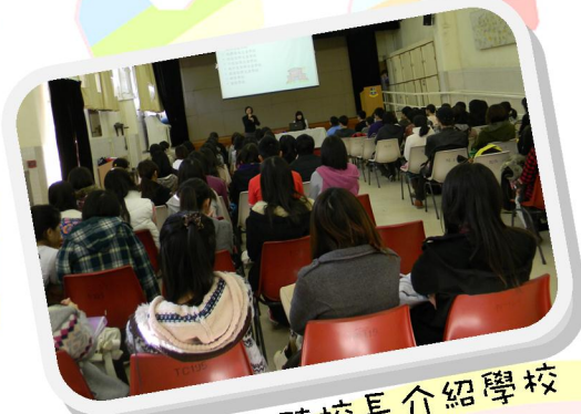
專心的聆聽校長介紹學校