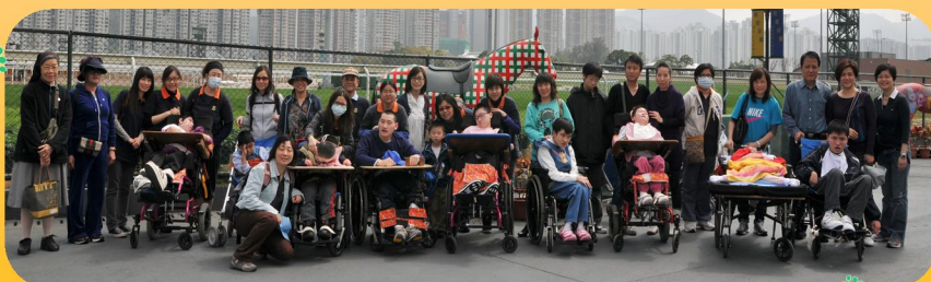
一齊影張人才濟濟的大合照先！