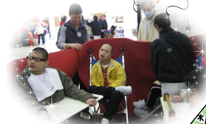
合力築起「我們的家」