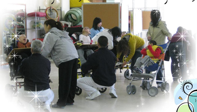
慈濟義工們與學生一起做早操