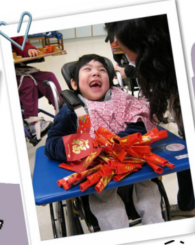
爆竹傳到我的手上了啊！