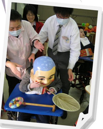
我的大頭佛表演精彩嗎？