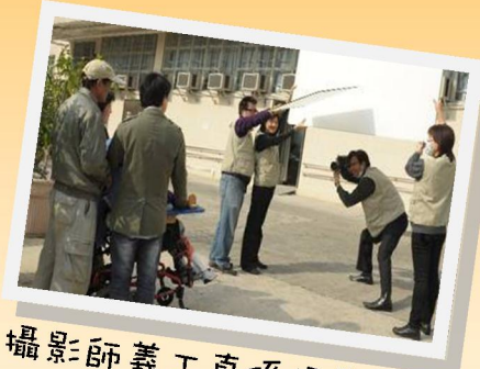
攝影師義工真係好專業呀！