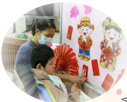
摸一摸，利是封的觸感很特別！