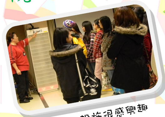
對音樂室的設施很感興趣