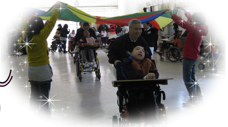
我們最喜歡玩大傘網！