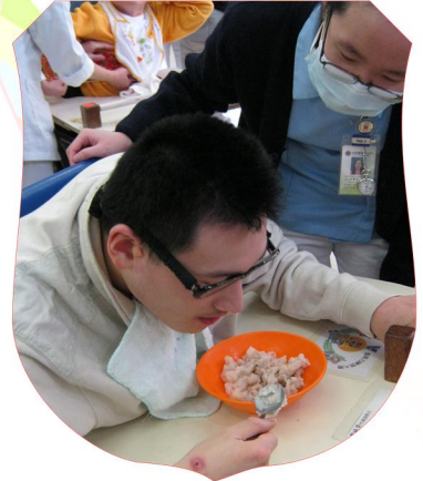
看顧學生品嚐糕點