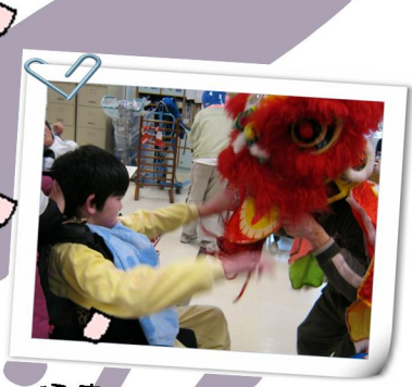
很喜歡舞獅的表演