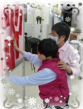
貼好揮春，為大家送上祝福