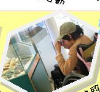
學生自行拍照 為遊蹤留影