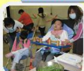
炒了的香草味確不同