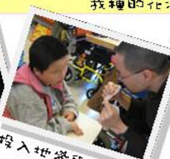
投入地參與朝聖活動