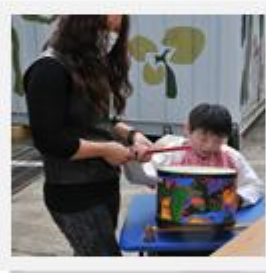
這位同學真有節奏感