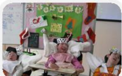
一班小DJ主持 現場節目