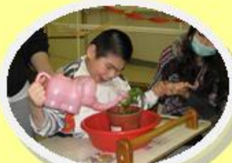
讓我為花兒澆水吧！