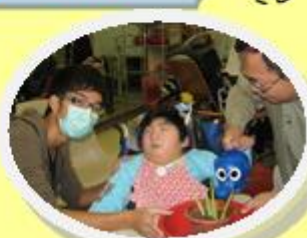
哥哥， 我種的花漂亮吧！