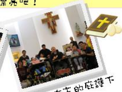
我們都在主的庇護下