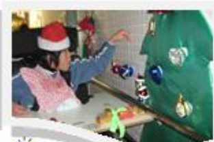
繽紛聖誕樹： 選擇飾物裝飾