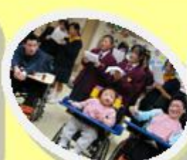
培立學校義工 為我們表演