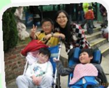
不同的家庭互相認識