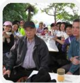
品嚐美味的山水豆腐花 美景當前當然要拍照留念啦!