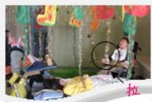
聖誕老人送禮物： 拉動彩帶有禮物 掉下來