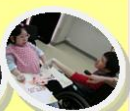
同學們互相握手問好