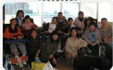
一班教職員探望畢業生