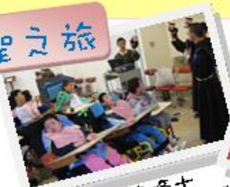
專注地聽修士 講聖經故事