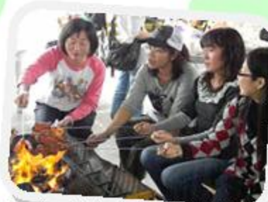
家長及教職員歡聚暢談