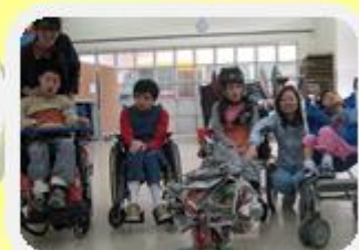
我們合力做的聖誕樹