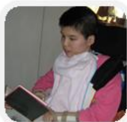
學生一同頌讀經文