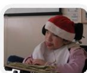
觸摸茅草感受 小耶穌出生的地方