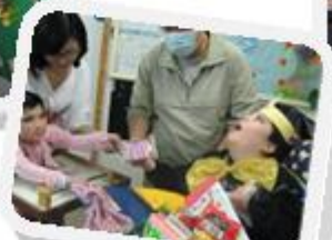
樂仁郵箱： 同學和教職員 寄出心意和祝福