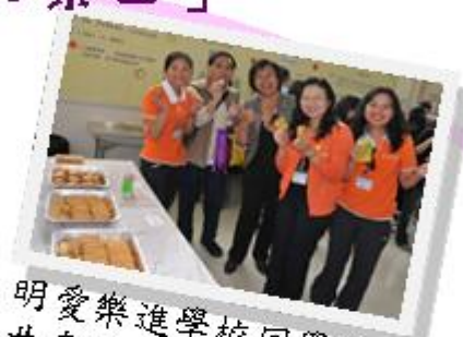
明愛樂進學校同學製作的曲奇餅，水準很高呢!