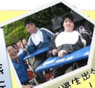
教職員與學生出外 旅行，真開心！