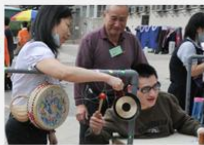
聽，這個樂器的聲音很特別呢!