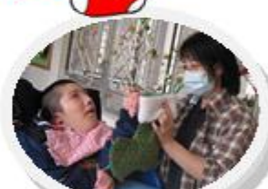
聖誕尋寶「禮」： 內有不同觸感的禮物