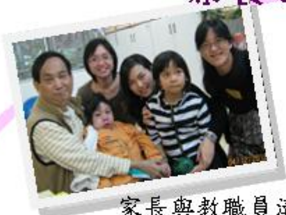
家長與教職員溝通學生的學習情況