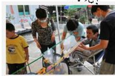
同學仔都玩得很投入呢!