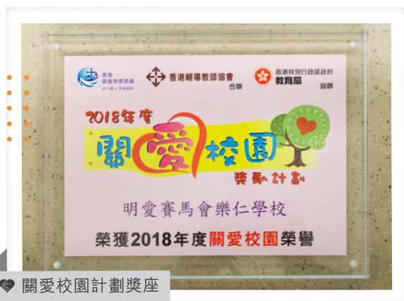
關愛校園計劃獎座

本年度本校參加了「關愛校園獎勵計劃」，並榮獲「關愛校園」榮譽獎項。學校致力為學生及家長提供專業教育及康復服務、積極建設關愛「醫療情況複雜個案照顧者」的資源和社區中心，我們亦十分關顧教職員的身心健康，特別重視「職安健」，由校長帶動及鼓勵同事每天做伸展運動；又透過不同形式的活動，例如「天使對對碰」、「每日一個Like」等，讚賞和肯定同事的努力及付出，以激勵士氣及激發熱誠。本校會繼續努力建立一個關愛每位持份者的校園環境，傳遞「關愛共融」的信息。