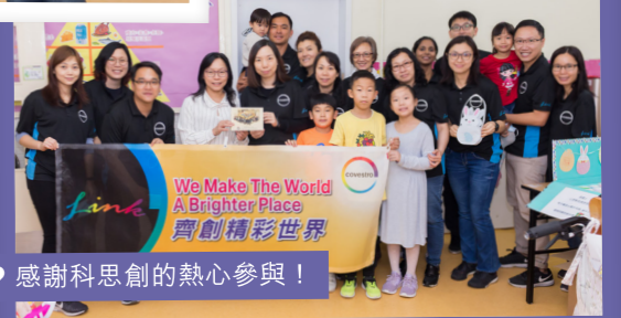
感謝科思創的熱心參與！