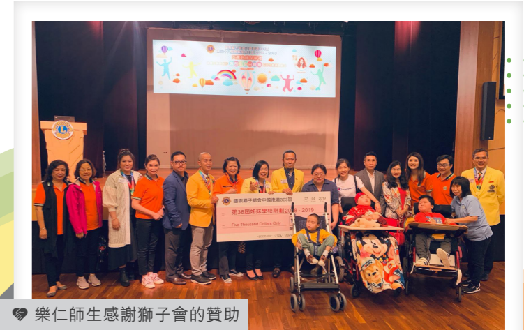
樂仁師生感謝獅子會的贊助