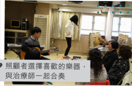
照顧者選擇喜歡的樂器，與治療師一起合奏