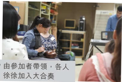
由參加者帶領，各人徐徐加入大合奏

透過音樂，觸動照顧者的回憶，感動同路人的呼應；照顧者，各有獨特的故事，走在一起合奏「關愛自己，同行有你」的旋律，點滴在心。感謝大家的信任及支持！