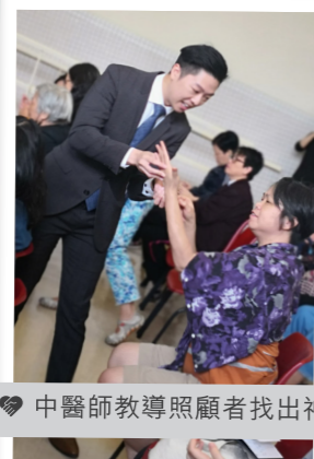
中醫師教導照顧者找出神門穴以紓緩壓力