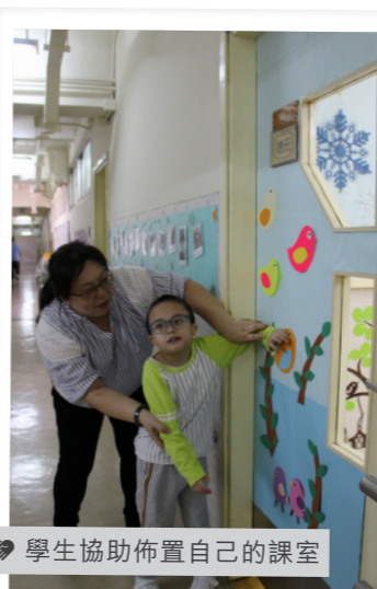
學生協助佈置自己的課室