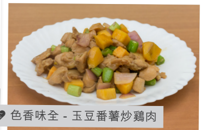
色香味全 - 玉豆番薯炒雞肉