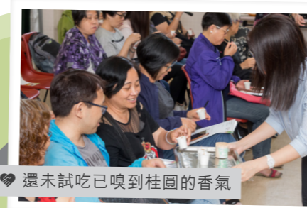
還未試吃已嗅到桂圓的香氣