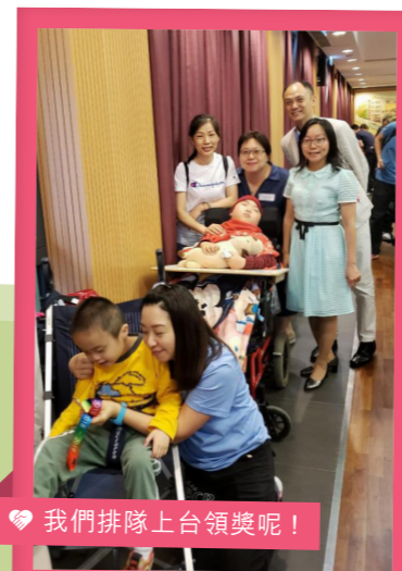
我們排隊上台領獎呢！