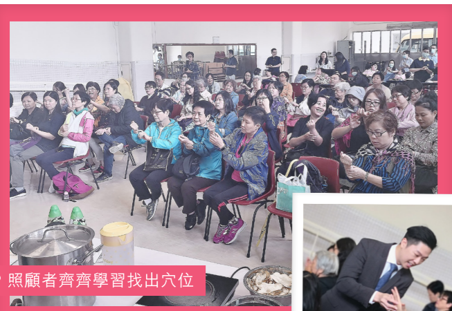
照顧者齊齊學習找出穴位

一如既往，中醫師為照顧者準備美食煮意，本次帶來了桂圓杞子粥及「核桃佛手飲」，兩者皆有助安神及減壓。時間飛逝，一個半小時的講座雖已結束，照顧者仍繼續踴躍發問，提出不少健康問題，中醫師皆逐一細心解答，各照顧者身心口腹可謂滿載而歸。