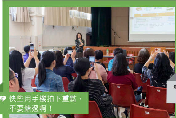
快些用手機拍下重點，不要錯過啊！