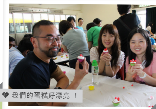
我們的蛋糕好漂亮！