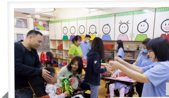
好熱鬧的一幕：有的拍照，有的遊戲，大家都很高興

感謝科思創(香港)有限公司、智樂兒童遊樂協會、融我在共融義工服務團及長沙灣天主教英文中學義工的貢獻，讓4月13日的遊戲日——這個一年一度的樂仁盛事錦上添花。工作人員在各遊戲攤位悉心準備讓學生及家長盡情玩樂，包括超動感隧道、笑笑影相館、繽紛跳跳復活蛋、還有下午茶製作呢！