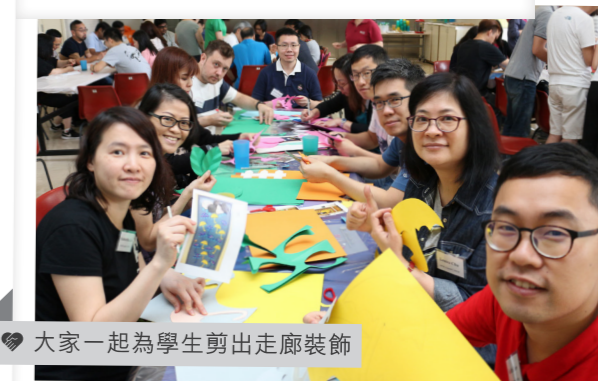
大家一起為學生剪出走廊裝飾

為學生製作教具「感官小花亭」及輕黏土紙杯蛋糕。有賴社會各界的眷顧及支持，樂仁感激各位義工的濃情厚愛，為學生及其家庭送上源源不絕的支持和鼓勵。