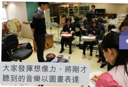
大家發揮想像力，將剛才聽到的音樂以圖畫表達