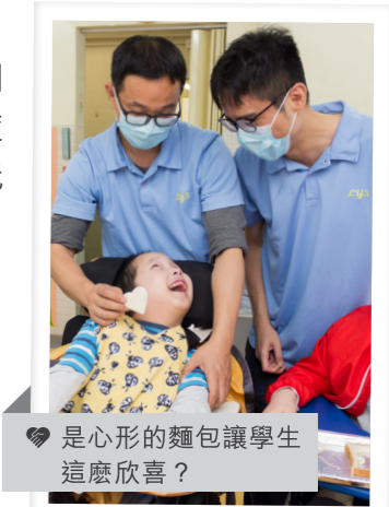
是心形的麵包讓學生這麼欣喜？