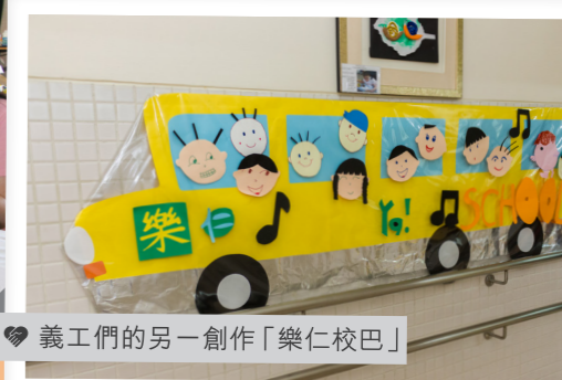
義工們的另一創作「樂仁校巴」