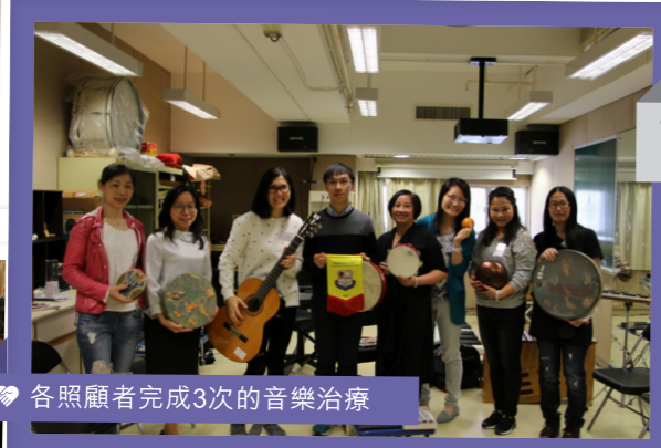
各照顧者完成3次的音樂治療