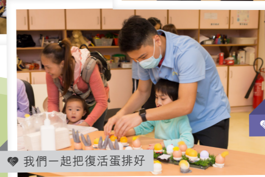
我們一起把復活蛋排好