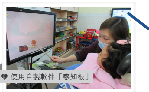
使用自製軟件「感知板」

當學生運用眼動儀進行學習時，教師會因應學生的能力、興趣及特別需要等，設計適性教學軟件，讓學生按部就班地學習。學生初接觸眼動儀時，教師運用自製軟件「感知板」，讓學生的眼球隨意移動，引發電腦熒幕中圖像的移動，從察覺至建立早期因果關係概念，進階至操控圖像移動。