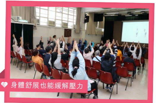
身體舒展也能緩解壓力