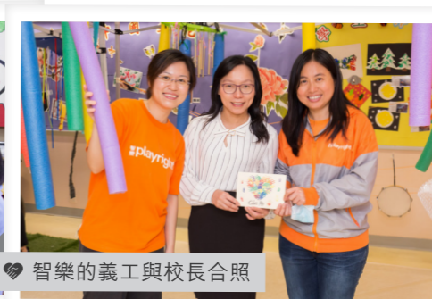
智樂的義工與校長合照